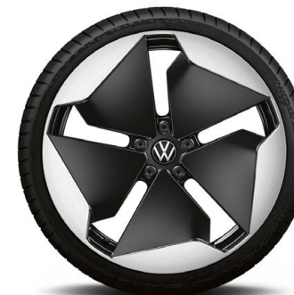
Lettmetallfelger 7,5 x 20" «Sanya»