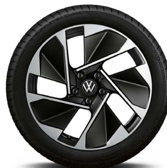
Lettmetallfelger 7,5 x 18" «East Derry»